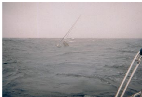
4. Nach nur 20 Minuten sinkt die Yacht