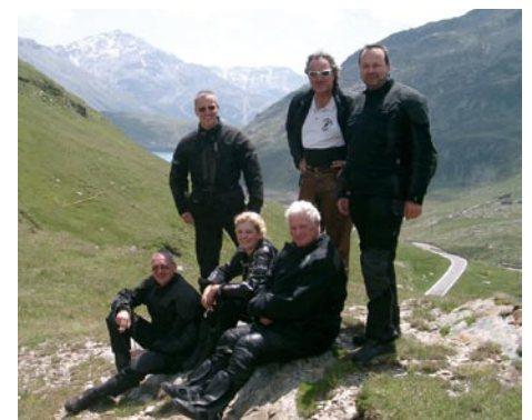
Die Pantaenius Biker Crew