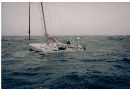
3. Das Schiff ist aufgegeben