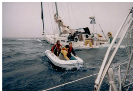
2. Rettung der Crew