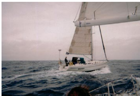
1. Hilfe über Notruf herbeigerufen

Zusätzlich hatte er den Schaft angebohrt, was die Stabilität beeinträchtigte. Beides führte zum Bruch des Schaftes und Verlust des Ruders. Zur Vermeidung solcher Risiken, ist es dringend ratsam, bauliche Veränderungen nur von einem Fachbetrieb durchführen zu lassen.